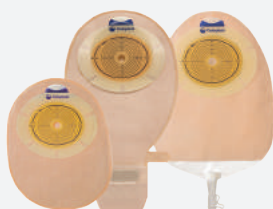
SenSura® 1 peça com base adesiva plana e convex light

A ampla variedade da linha SenSura® atende os diferentes perfis corporais e estilos de vida.